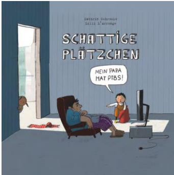
Abbildung: Titelbild des Kinderbuchs „Schattige Plätzchen“

Ihr Kind nimmt etwaige Veränderungen genau wahr, auch wenn es dies oft nicht benennen kann. Sie können für Ihr Kind hilfreich sein und dessen Ängste, Verunsicherung, vielleicht sogar Schuldgefühle deutlich mindern, indem Sie die Fragen, die das Kind beschäftigen, in einer altersgerechten Form aktiv ansprechen. Zum Beispiel sollte dem Kind erklärt werden, warum Mutter/Vater in den Einsatz musste, was dort passiert ist (hier sollten allzu gewalt-same Details natürlich vermieden werden),