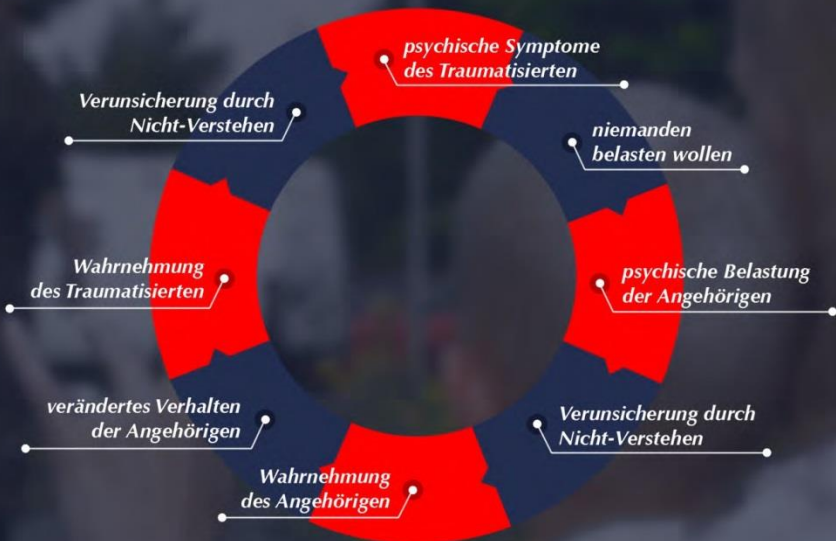
Abbildung: „Teufelskreis“ des Umgangs mit traumatisierten Soldatinnen und Soldaten

dass durch die fehlende Information, dass etwas Belastendes vorgefallen ist, für diese kein Grund für die Veränderungen erkennbar ist. Dies führt zu Verunsicherung und zur Entwicklung eigener Theorien und Phantasien. Hier- bei können möglicherweise schon bestehende negative Annahmen oder Schuldgefühle noch verstärkt werden oder auch einfach ganz neue Zweifel und Befürchtungen aufkommen (Beispiele: „sie/er ist nicht glücklich mit mir“, „sie/er hat kein Interesse mehr an mir“, „es gibt eine Andere/einen Anderen“, „sie/er kann mich nicht mehr leiden“). Einhergehende Veränderungen im Erleben und Verhalten des Umfelds werden dann wiederum von den psychisch belasteten Soldatinnen und Soldaten wahrgenommen, jedoch ebenfalls nicht verstanden, wenn die zugrunde liegenden Gedanken nicht besprochen werden. Nun entstehen bei den Traumatisierten Verunsicherung sowie Gefühle und Reaktionsweisen, die denen der Angehörigen ähneln (Ängste und Schuldgefühle), und so ist unmerklich ein „Teufelskreis“ in Gang gekommen - genährt durch Sprachlosigkeit (siehe unten stehendes Schema am Beispiel von Angehörigen).