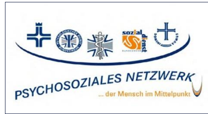
Abbildung: Logo des Psychosozialen Netzwerks der Bundeswehr

Ein zusätzliches Hilfsangebot nach Ausland- Einsätzen sind die Einsatz- nachbereitungsseminare. Hierbei soll ein innerliches Abschließen mit dem Einsatz, aber auch eine Früherkennung npsychischer Störungen ermöglicht werden. Als Teil des PAUSE-Programms der Bundeswehr können zudem zur Erholung kostenlose Präventivkuren absolviert werden. Diese Kuren finden für 2-3 Wochen in zivilen Kliniken statt und helfen, etwaige Belastungen und Erkrankungen zu erkennen, erste Stabilisierungs-Techniken zu vermitteln und ggf. zu weiter gehender Therapie zu motivieren. An diesen Präventivkuren können auch Angehörige zu einem Selbstkostenpreis teilnehmen.