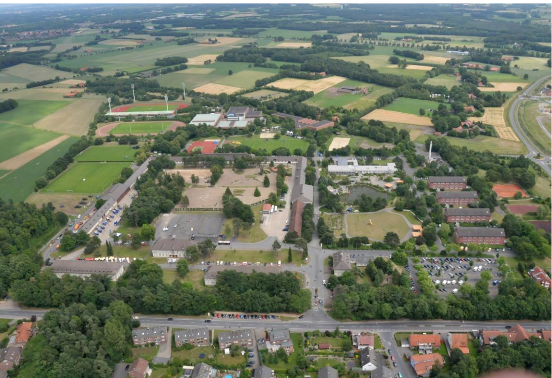
Abbildung: Sportschule der Bundeswehr Warendorf

Wenn diese ersten Schritte zu einer Heilung noch eine zu hohe Hürde darstellen, können Sie sich zunächst über die App „Coach PTBS“ oder im Internet auf www.angriff-auf-die-seele.de oder www.ptbs-hilfe.de informieren. Es sind dort Beiträge zu einsatzbedingten Belastungen, posttraumatischen Erkrankungen sowie Therapiemöglichkeiten zu finden. Daneben gibt es anonyme Stresstests zur selbstständigen Durchführung mit einer automatisierten Antwort je nach Testergebnis. In gleicher Form existiert ein Kurzfragebogen zur Alkoholproblematik. Auf der Seite www.ptbs-hilfe.de kann zudem ein ca. 20-minütiger Lehrfilm zur PTBS angesehen werden.