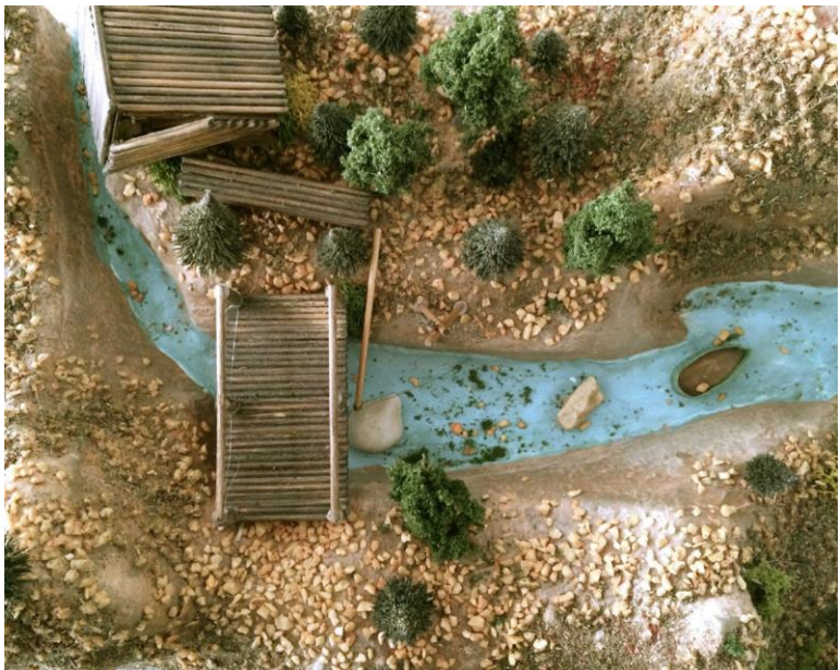
Abbildung: Ergotherapie- Arbeit, bei der das innere Fantasie-Bild eines Ortes der Sicherheit und Ruhe plastisch dargestellt wurde.

Therapeutinnen und Therapeuten unterliegen der ärztlichen Schweigepflicht und dürfen daher niemals ohne Zustimmung ihrer Patientinnen und Patienten mit dritten Personen (also auch nicht mit Angehörigen) über die Inhalte der vertraulichen Arzt-Patient-Gespräche sprechen.