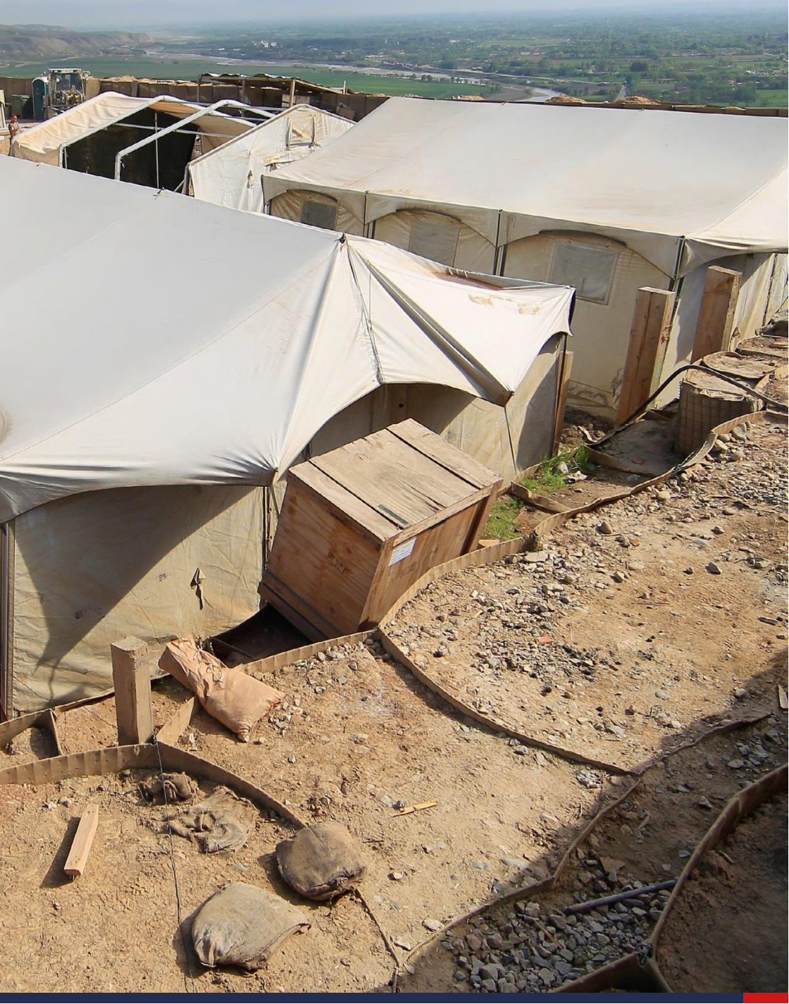
Abbildung: Lebensbedingungen in einem Feldlager sind kein Trauma, tragen aber zur Gesamtbelastung der Soldaten bei.