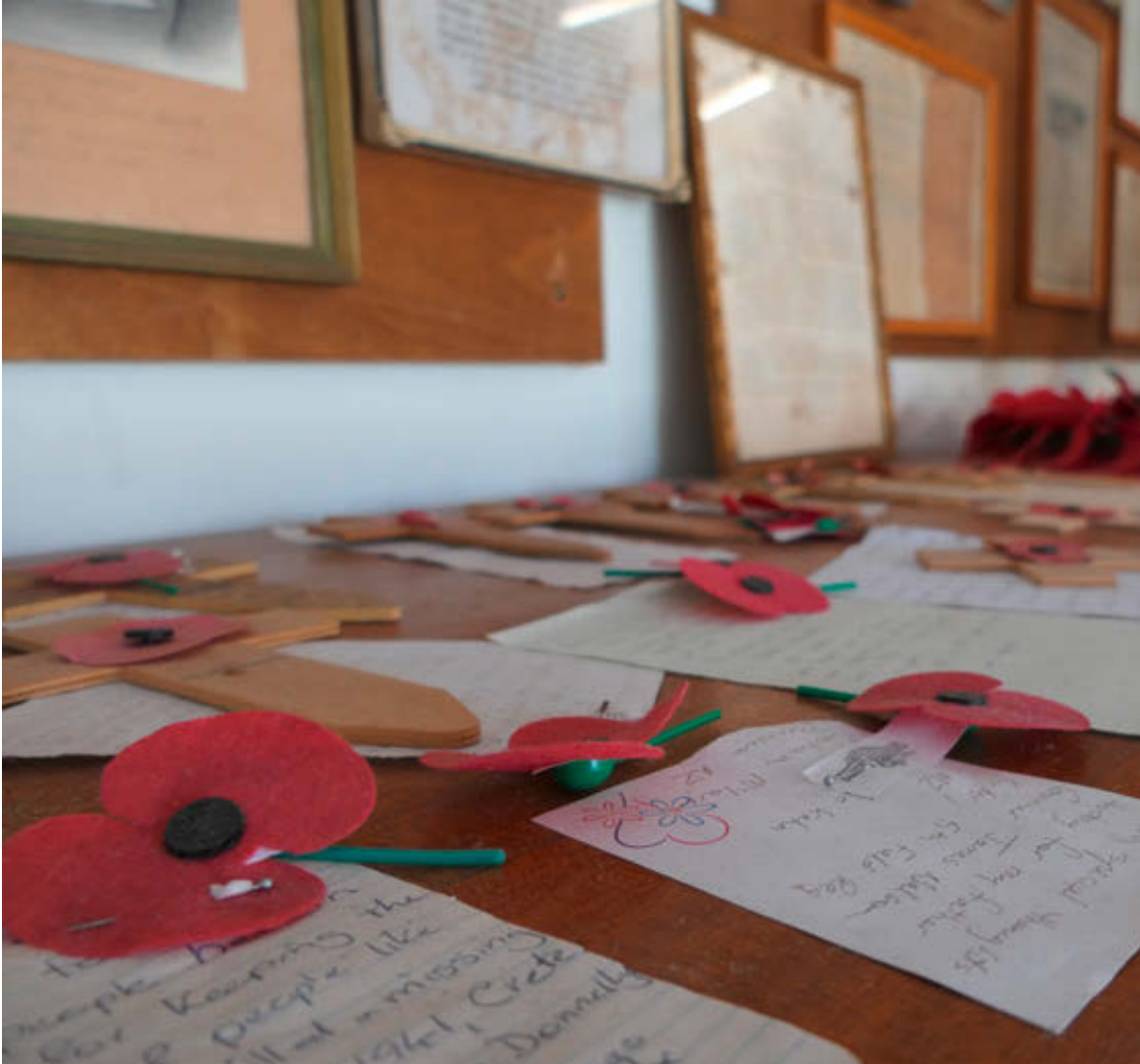
Gedenkbrieve von Familien aus Australien und Neuseeland, im Museum in Galatas