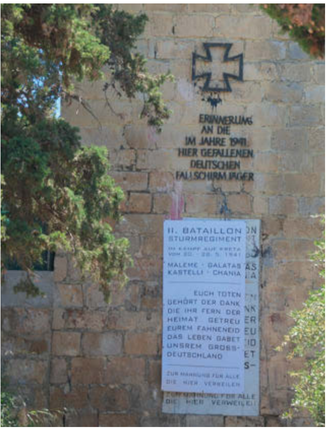
Fallschirmjägerdenkmal nahe Chania