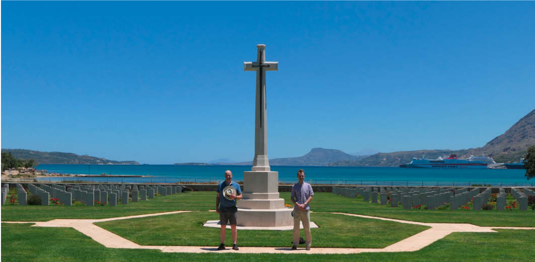
Zentraler Gedenkort für die gefallenen Alliierten (CREFORCE), Souda Bay War Cemetery in Chania