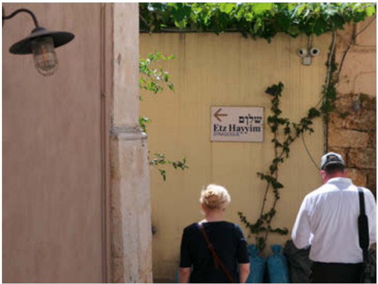
Etz-Hayyim-Synagoge in Chania-Stadt