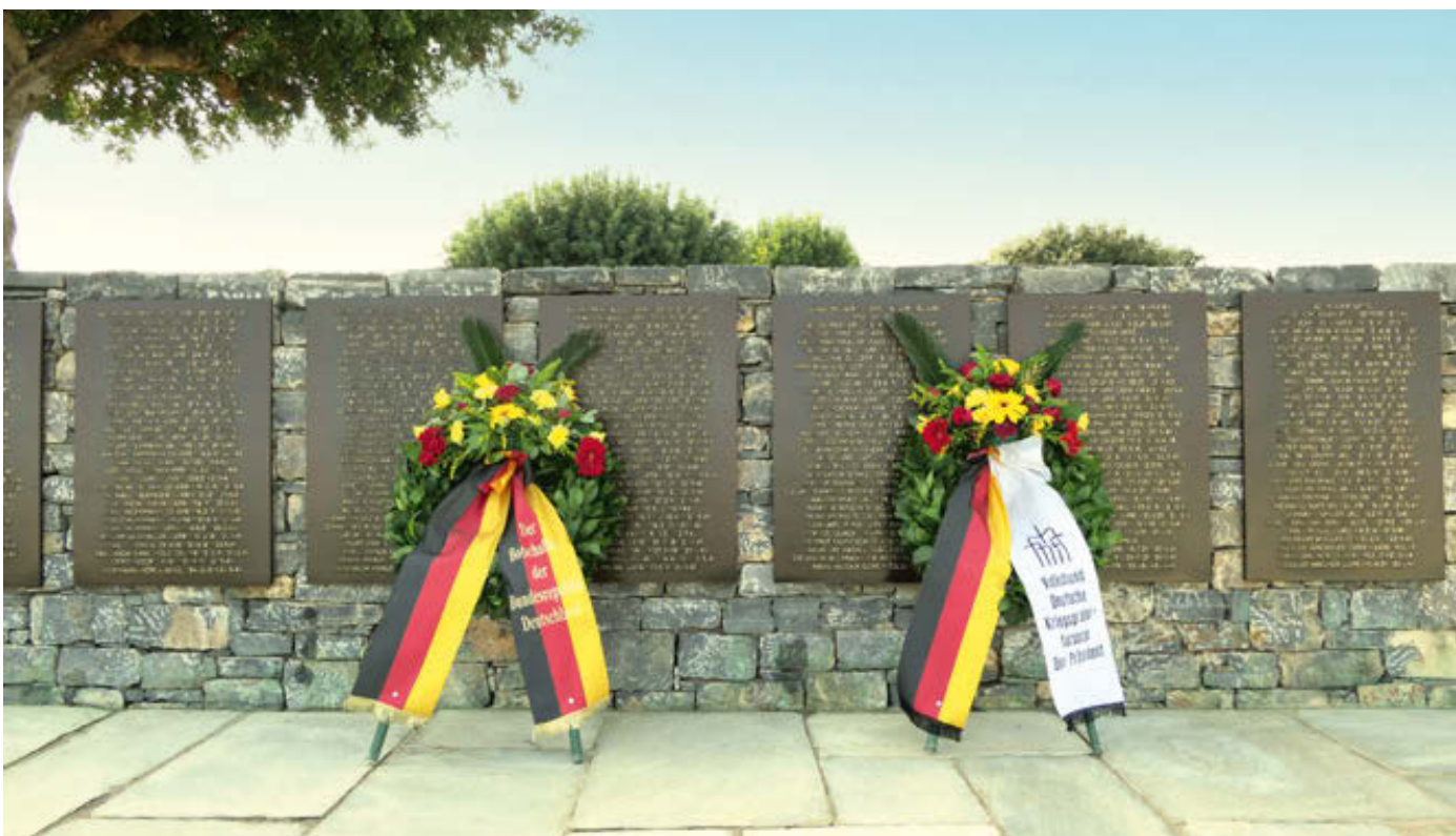
Gedenken an 343 vermisste deutsche Wehrmachtssoldaten, Kriegsgräberstätte Maleme