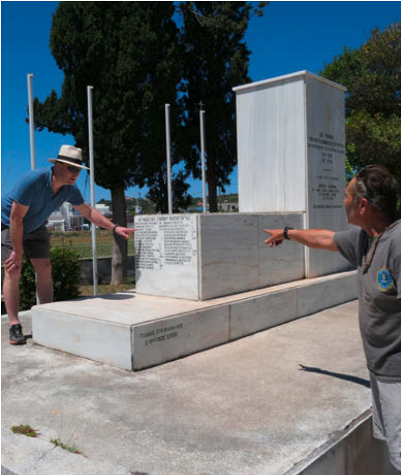
Kretisches Denkmal in der Nähe des Agia-Gefängnisses