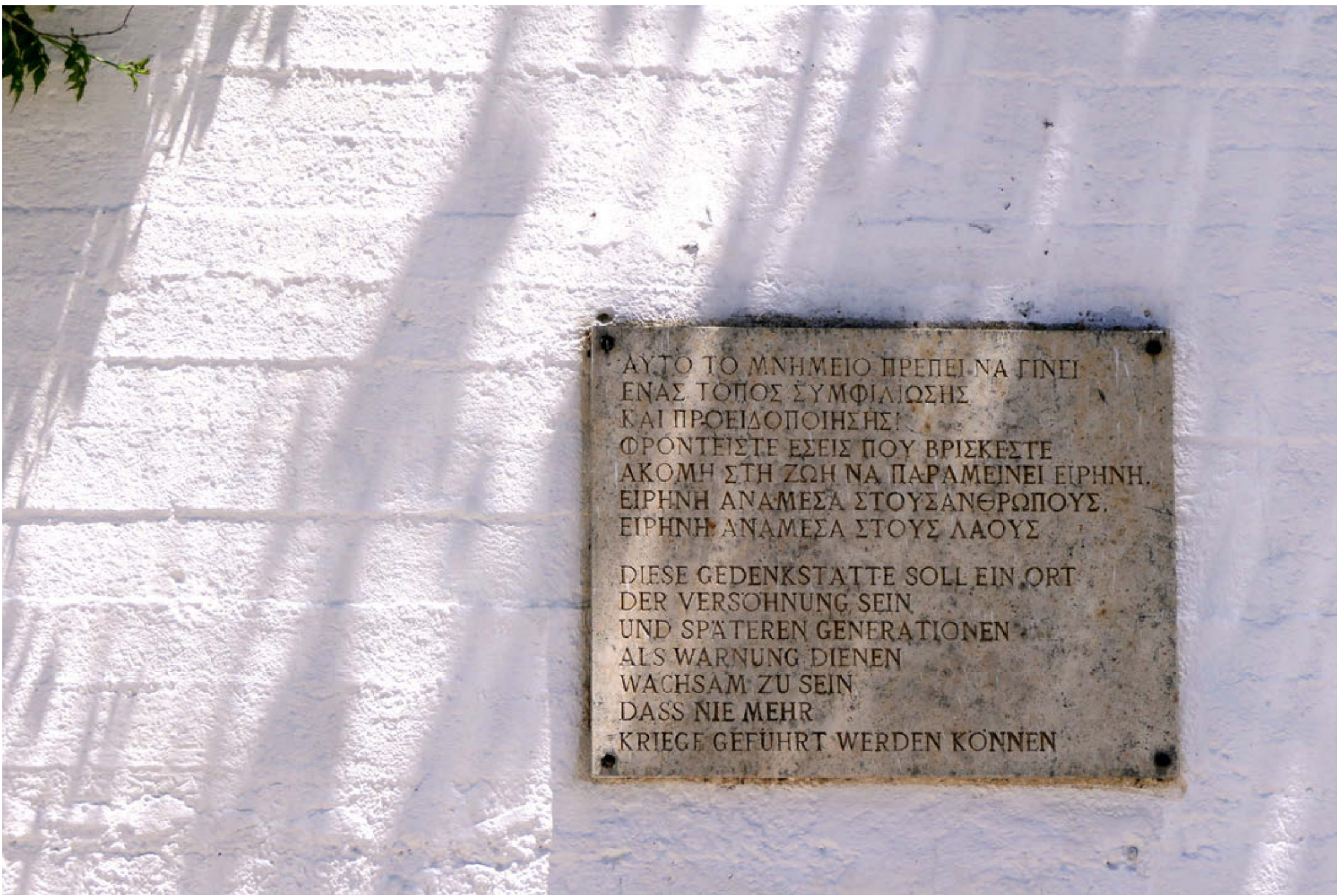
Zweisprachige Gedenktafel in Floria, unterhalb des Kriegerdenkmals für Gebirgsspiönere