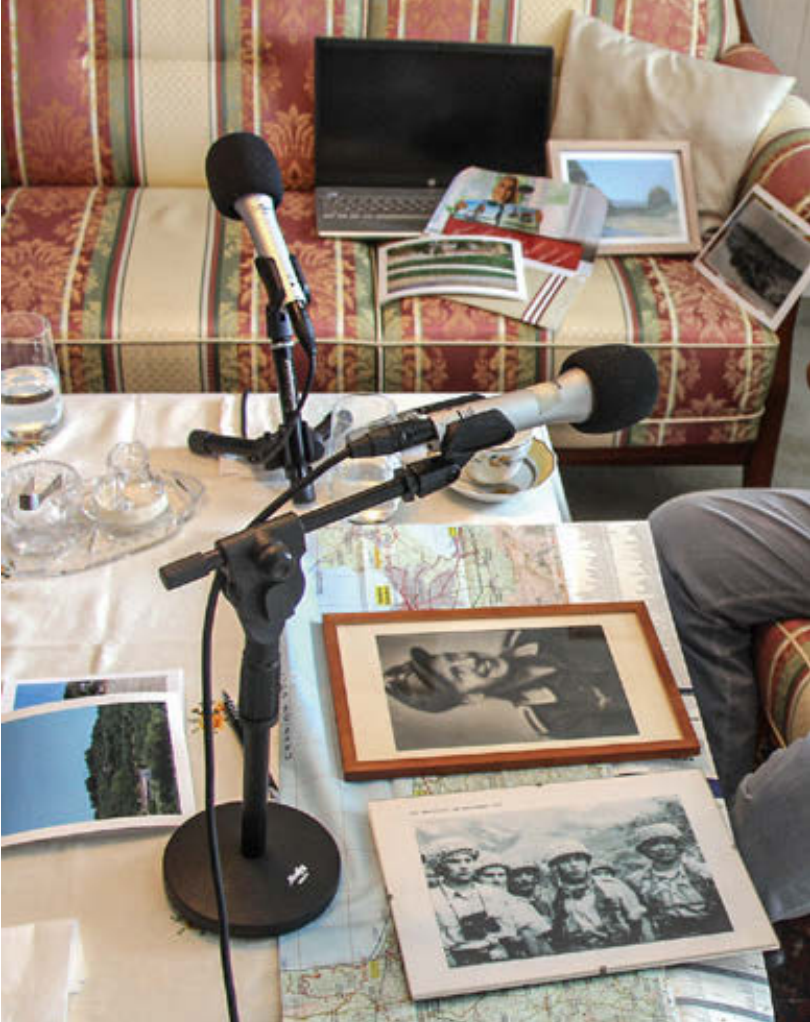
Gespräche und bildliche Erinnerungen