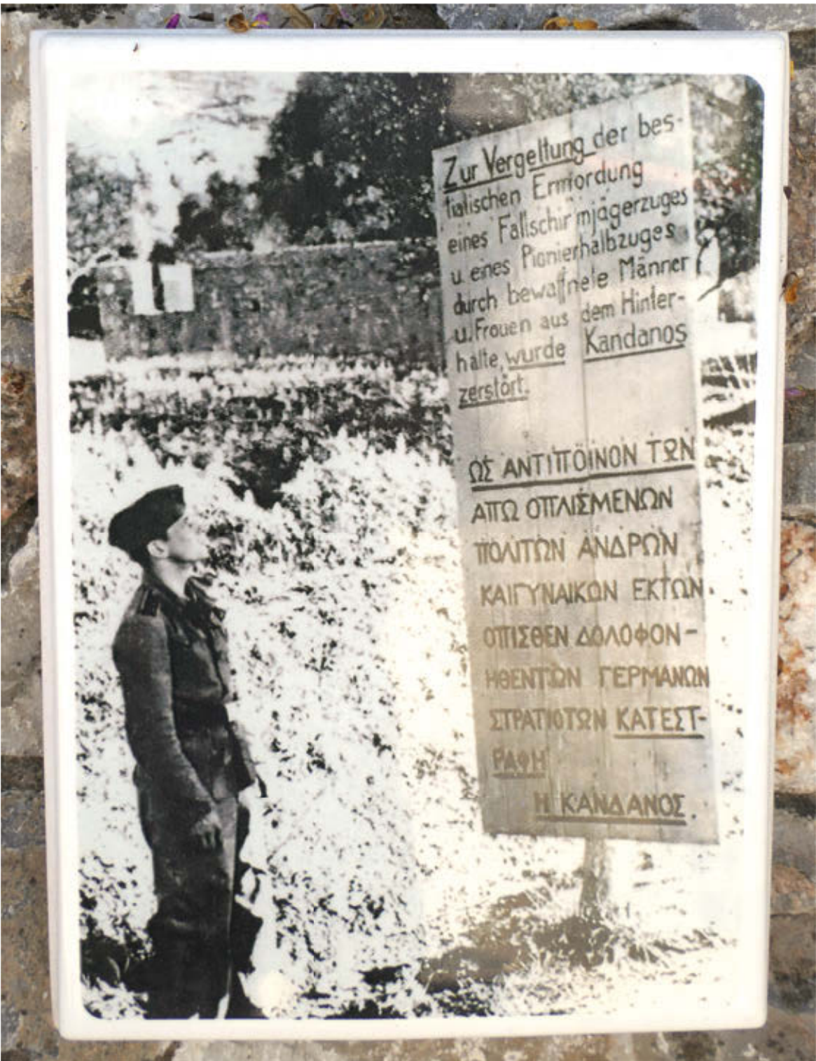
Tafel der deutschen Besatzer im Märtyrerort Kandanos