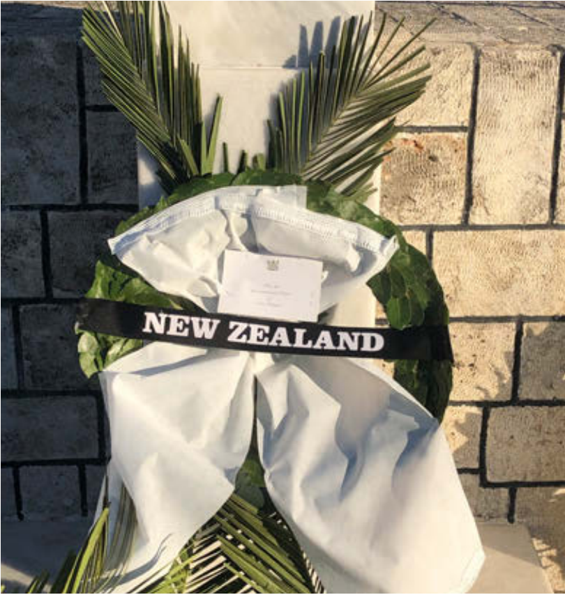
Neuseeländisches Gedenken in Galatas