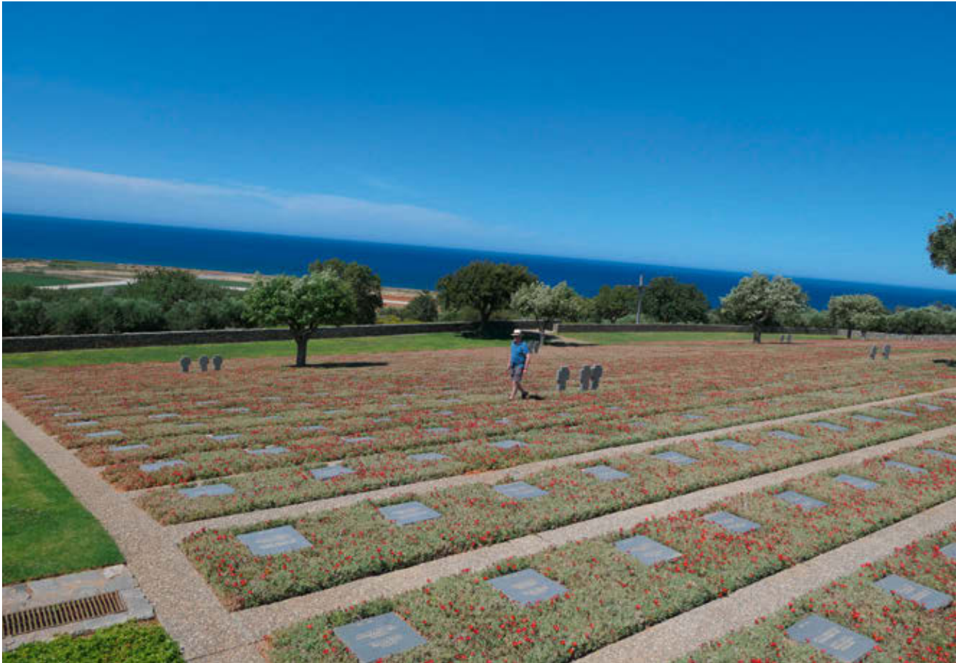
Kriegsgräberstätte Maleme, „Höhe 107“, im Hintergrund der Flugplatz