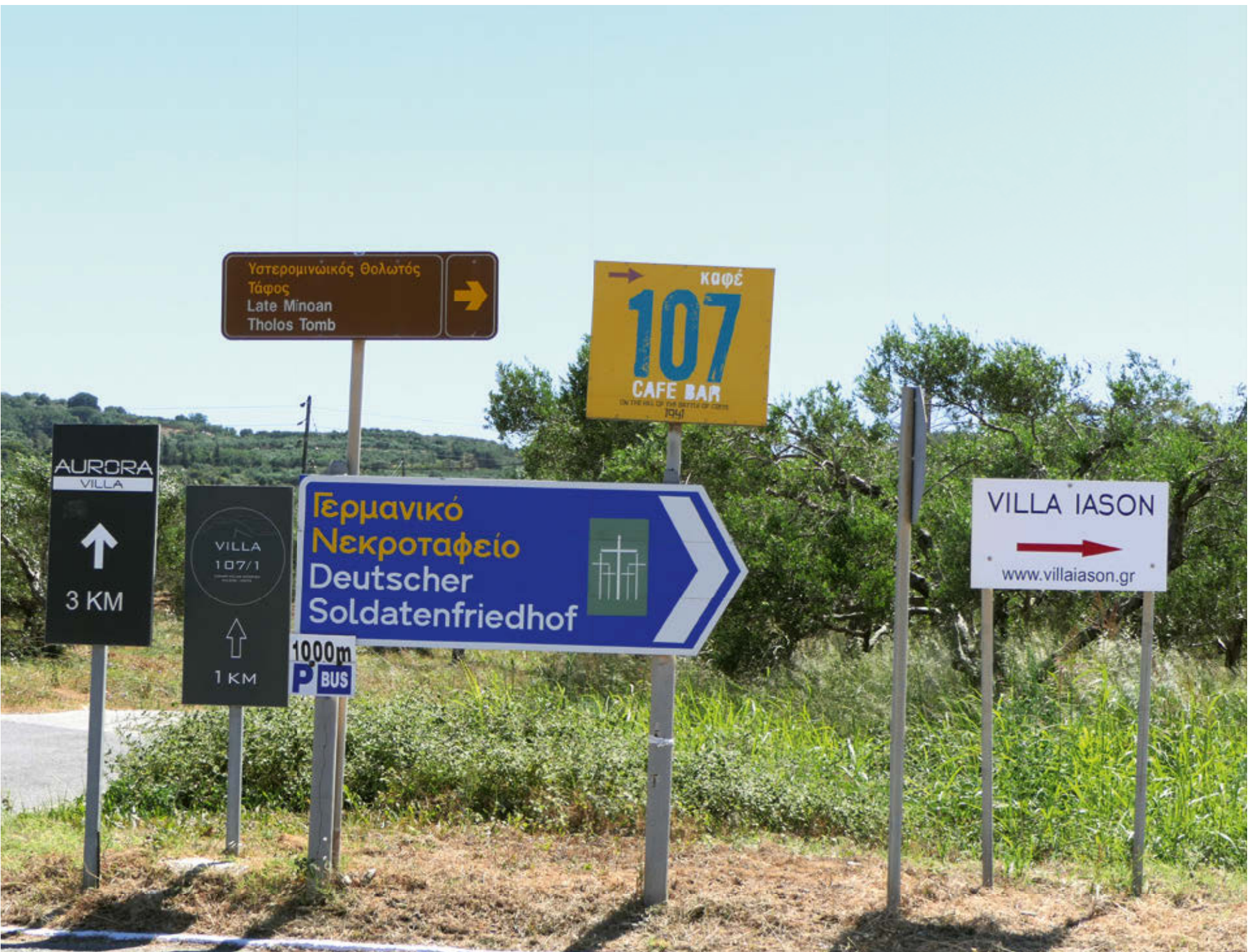
Letzte Kreuzung vor „Höhe 107“, Kriegsgräberstätte Maleme