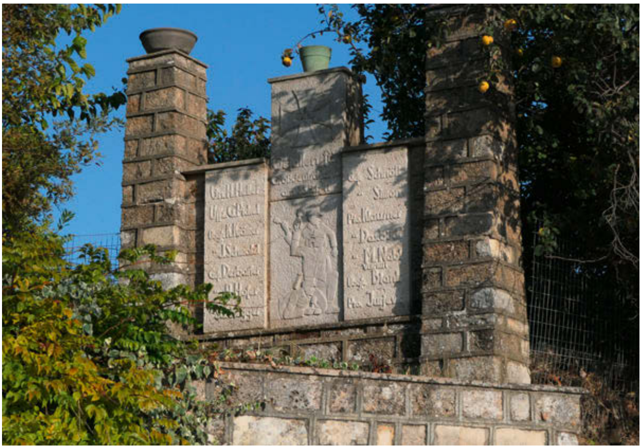
Gebirgsjägerdenkmal in Floria