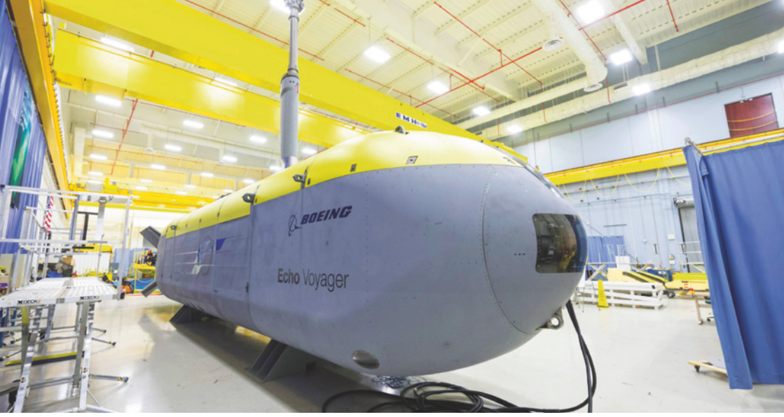
Unbemannte Zukunft: Das 17 Meter lange, autonome U-Boot „Echo Voyager“ war 2016 der Prototyp für das Large Unmanned Underwater Vehicle „Orca“ der US Navy heute