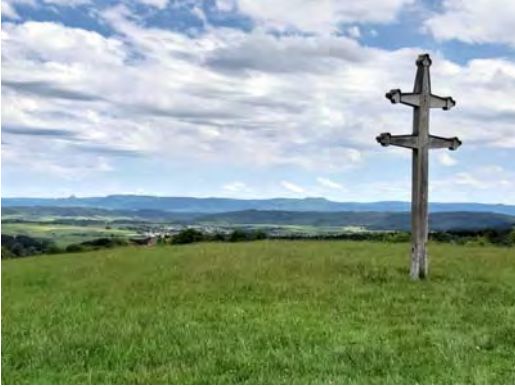
Blick vom Kloster auf die Schwäbische Alb und den Hohenzollern

Das Berneuchener Haus Kloster Kirchberg ist Quartier der Motorradrüstzeit 2024. Von dort aus unternehmen wir Tagestouren: Eine Stadtführung in der Universitäts- und Wissenschaftsstadt Tübingen steht auf dem Programm. Ein Besuch in Konstanz am Bodensee erschließt das für die deutsche Geschichte so wichtige Konzil, das von 1414 bis 1418 dort tagte. Auf dem Weg zum Feldberg , dem höchsten Berg des Schwarzwalds, machen wir Station in Königsfeld und besichtigen dort die bedeutende Niederlassung der Herrnhuter Brüdergemeine.