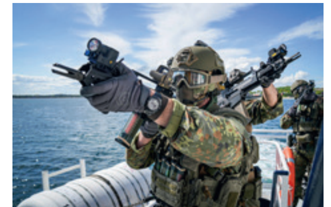
Eine Boardingübung der Bordeinsatzkompanie 1 in Eckernförde.