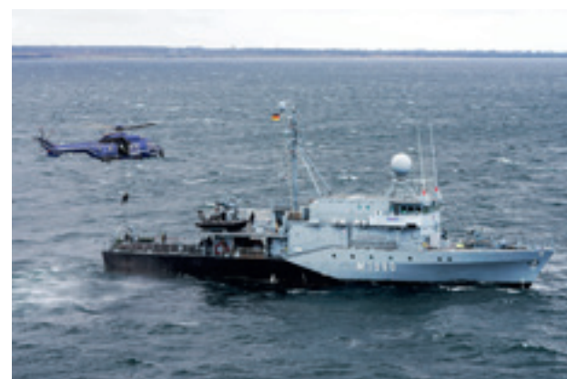
Der Hubschrauber der Bundespolizei bringt eine Person an Bord des Hohlstabenbootes M 1090 "Pegnitz".