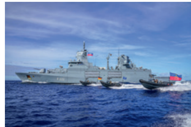
Die Buster-Boote der Fregatte F 222 während des Manövers RIMPAC im Rahmen des Indo-Pacific Deployment 2024.