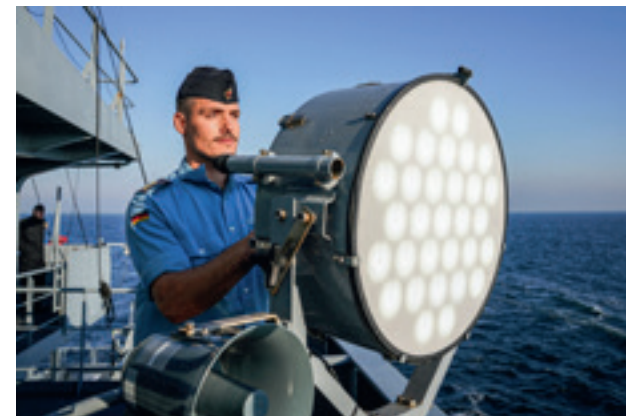
Ein Soldat der Besatzung vom Tender Rhein bedient einen Scheinwerfer bei einer Signalübung während der Übung Northern Coasts 2024.