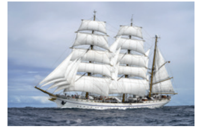
Das Segelschulschiff "Gorch Fock" bei ihrer 182. Aulandsausbildungsfahrt, beim Turn Portugal nach Spanien.