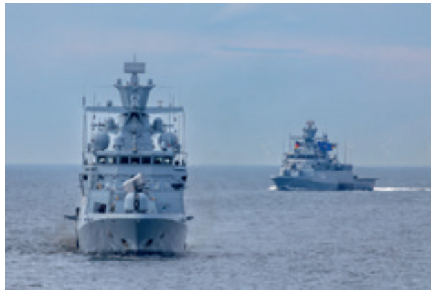
Die Korvetten "Magdeburg" (l.) und "Braunschweig" (r.) beim Marinemanöver Baltops 2025.