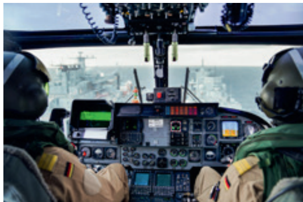
Der Bordhubschrauber "Sea Lynx" MK 88A über einem RAS-Manöver beim Indo-Pacific Deployment 2024.