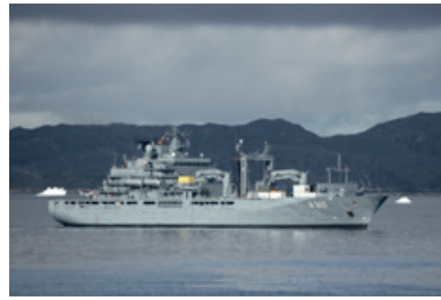
Der Einsatzgruppenversorger A 1411 "Berlin" läuft im Rahmen von Atlantic Bear 2025 den Hafen von Nuuk an.