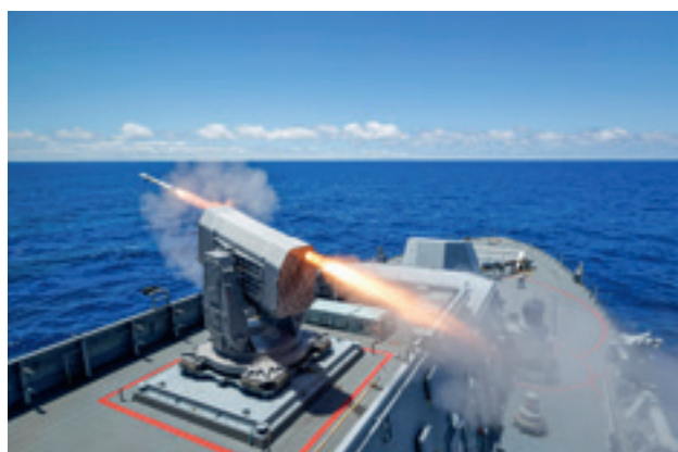
Abschuß eines Lenkflugkörpers RIM-116 RAM der Fregatte "Baden-Württemberg" während des Manövers RIMPAC.