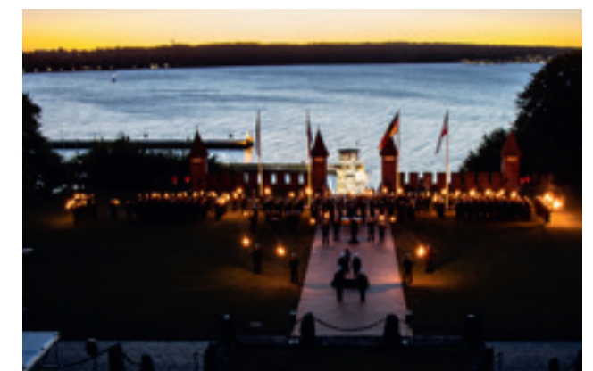
Vizeadmiral Frank Martin Lenski wird mit einem Großen Zapfenstreich an der Marineschule Mürwik feierlich verabschiedet.