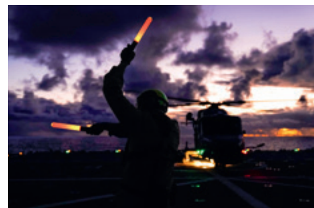
Flugbetrieb auf dem Einsatzgruppenversorger "Frankfurt am Main".