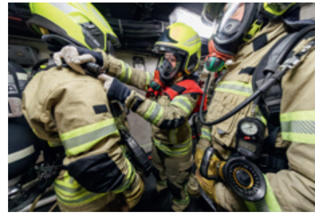
Übung einer Brandabwehrbekämpfung am Bord einer Fregatte.