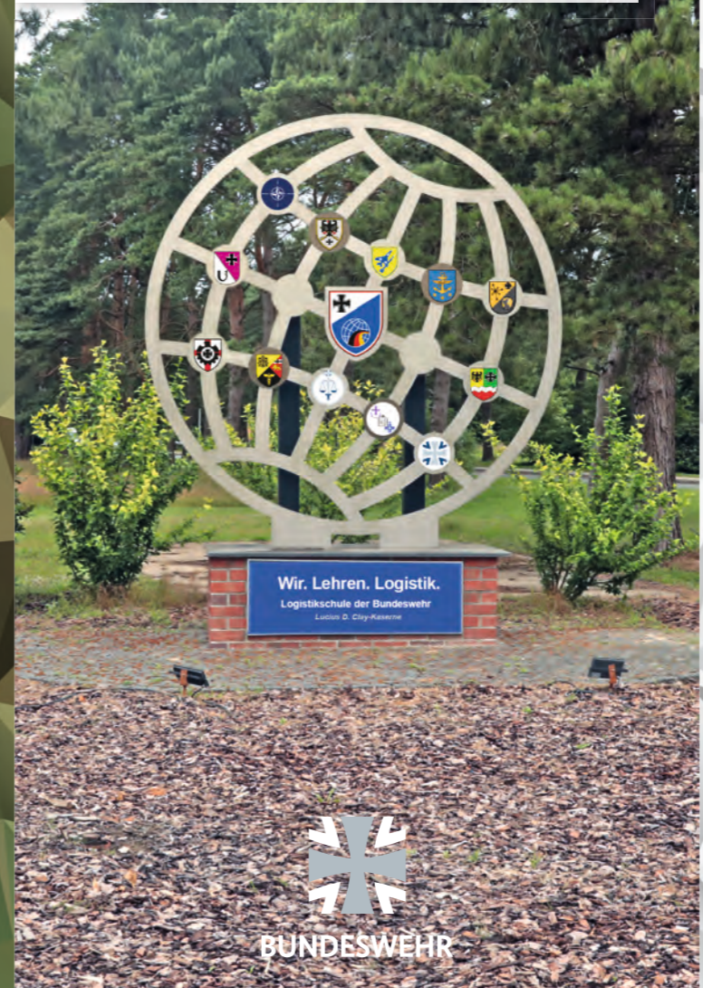
Wir. Lehren. Logistik. Logistikschiele der Bundeswehr Lucius D. Clay-Kaserne