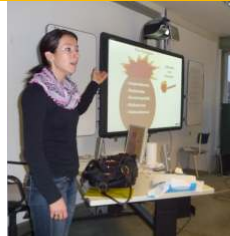
Unterricht Politische Bildung

Deutsch, Englisch, Mathematik und weitere Fächer wie Geschichte, Politische Bildung, Geografie, Physik, Bewerbertraining