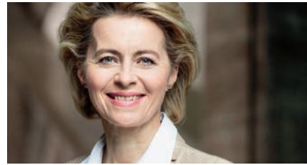
Ursula von der Leyen Bundesministerin der Verteidigung