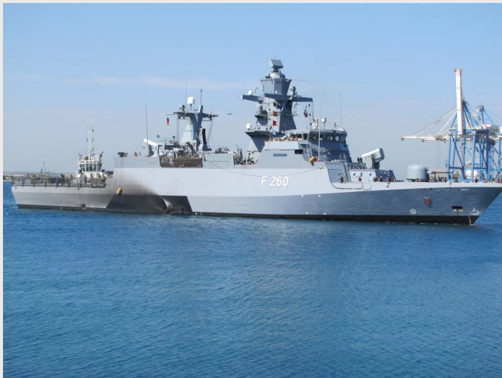
UNIFIL: Korvette BRAUNSCHWEIG