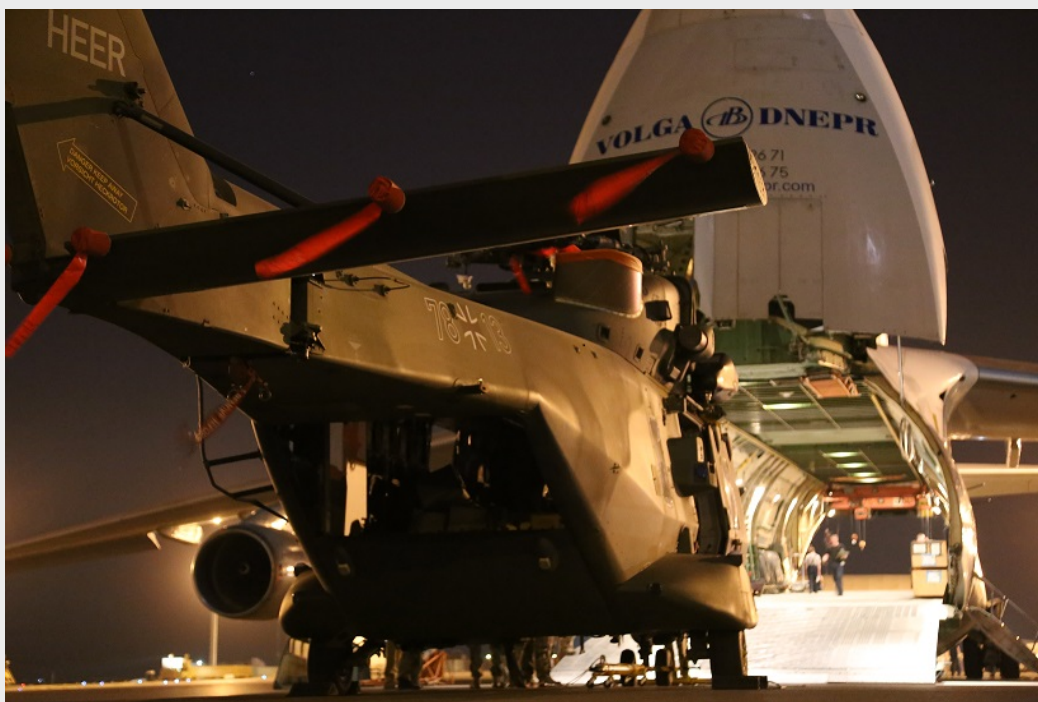
ISAF: NH90 vor Verladung in Antonov