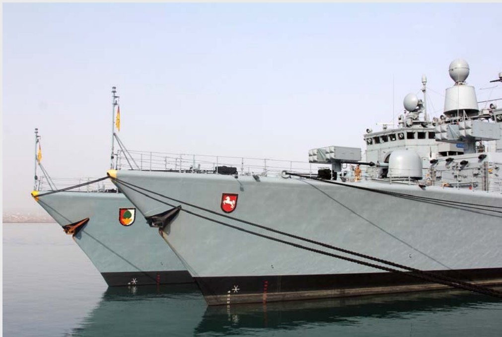
Atalanta: Wachwechsel FGS AUGSBURG – FGS NIEDERSACHSEN