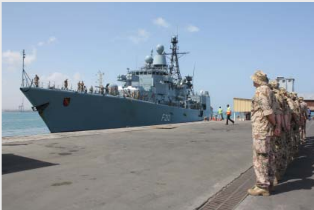
ATALANTA: Fregatte Karlsruhe legt in Dschibuti an