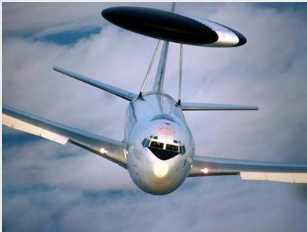
NATO AWACS bei Operation Active Endeavour (OAE)