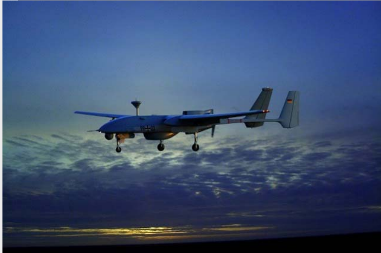
Heron 1 im Landeanflug

Die wöchentlich erscheinende zusätzliche Unterrichtung zur Lage in den Einsatzgebieten der Bundeswehr stellt einen weiteren Schritt zu mehr Transparenz im Rahmen der aktuellen Berichterstattung dar.