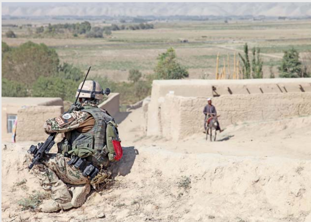
ISAF: Beobachtungspunkt in Bakhlan