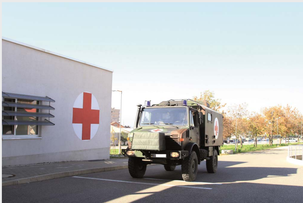
KFOR: Sanitätskraftfahrzeug