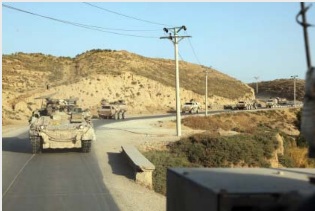
ISAF: Letzter Konvoi auf dem Marsch von Kunduz nach Mazar-e Sharif