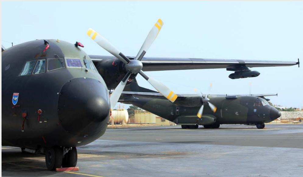
MINUSMA: Transall in Dakar