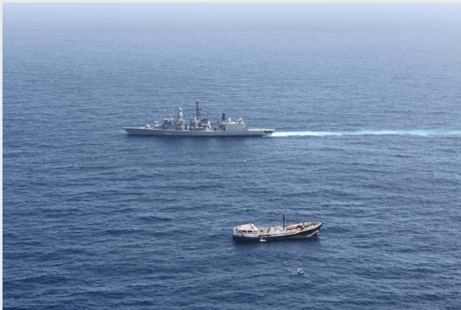
EU-geführter Einsatz ATALANTA: Fregatte Lübeck und befreite Dhau