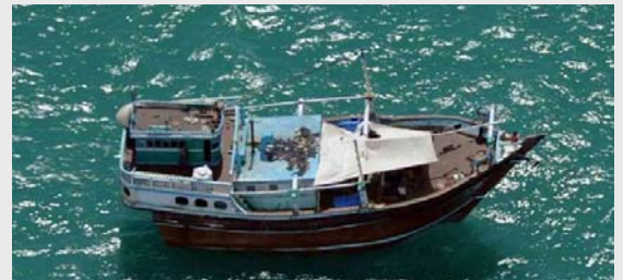
Dhau Typ Jelbut