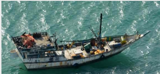
Dhau Typ Yemen

Darüber hinaus sind in der Vergangenheit teilweise auch weit größere Handelsschiffe, die Piraten in ihre Gewalt bringen konnten, als „Mutterschiffe“ eingesetzt worden.