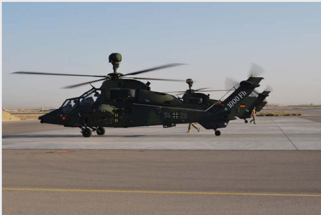
ISAF: 1000. Flugstunde UH TIGER