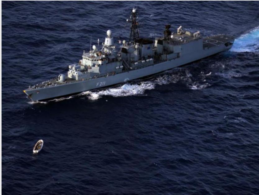
Fregatte KÖLN stellt Skiff (ATALANTA)