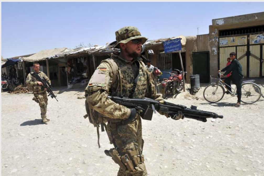
ISAF: Patrouille zu Fuß